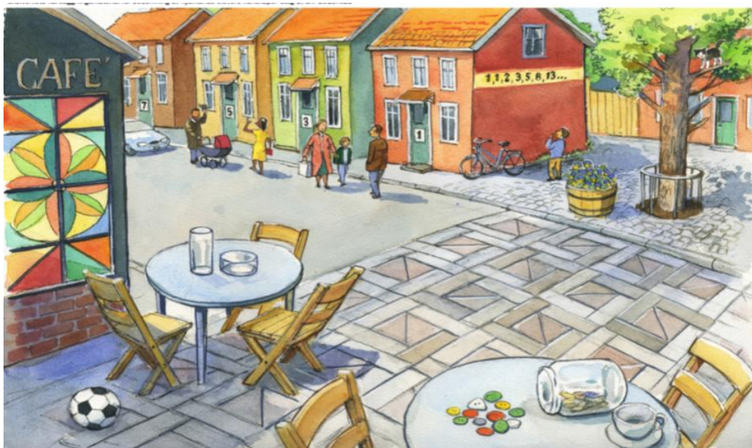
Rysunek będący podstawą rozmowy diagnozującej umiejętność matematycznego myślenia.

Proces diagnozy jest trzyetapowy , lecz jedynie dwa pierwsze etapy są obowiązkowe. Materiały w ramach procesu skonstruowane są w taki sposób, aby diagnozowanie umiejętności ( knowledge mapping ) mogło odbywać się w formie rozmów z uczniem. Są to rozmowy trwające nie dłużej niż 70 minut, wliczając czas na tłumaczenie. Długość rozmowy jest oczywiście regulowana i dostosowywana do wieku i możliwości ucznia. Etap pierwszy i drugi przewidują trzy takie rozmowy. Pierwsze spotkanie (etap 1) to wspólna rozmowa z uczniem i jego rodzicami/opiekunami podczas, której osoba diagnozująca koncentruje się na doświadczeniach i umiejętnościach językowych dziecka nabytych w kraju ojczystym oraz na jego odczuciach i oczekiwaniach w związku z rozpoczęciem nauki w nowym kraju. Pierwsze spotkanie to również doskonała okazja ku temu, by nawiązać pozytywny kontakt z uczniem, stworzyć dobry klimat pracy, który ułatwi przeprowadzenie kolejnych dwóch rozmów (etap 2) skupiających już się na umiejętności czytania i pisania ( litteracitet ) oraz umiejętności matematycznego myślenia ( numeracitet ).